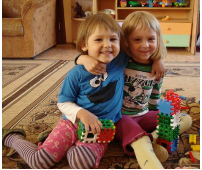
Twee van vier zusjes die in de crisisopvang wonen hebben het daar erg naar hun zin. Moeder is met de Noorderzon vertrokken, de drie vaders zijn zoek. De meisjes waren nauwelijks herkenbaar toen we hen bezochten, een enorm verschil met zoals we hen aantroffen. (zie laatste pagina onderaan)