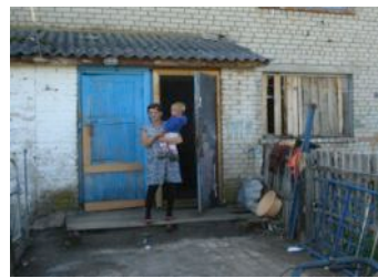
Vader en moeder zijn hopeloos verslaafd aan alcohol. Het huis is binnen een vuilnisbelt. Vier jonge kinderen tussen 2 tot 6 jaar werden kort na ons bezoek opgenomen in het crisiscentrum.